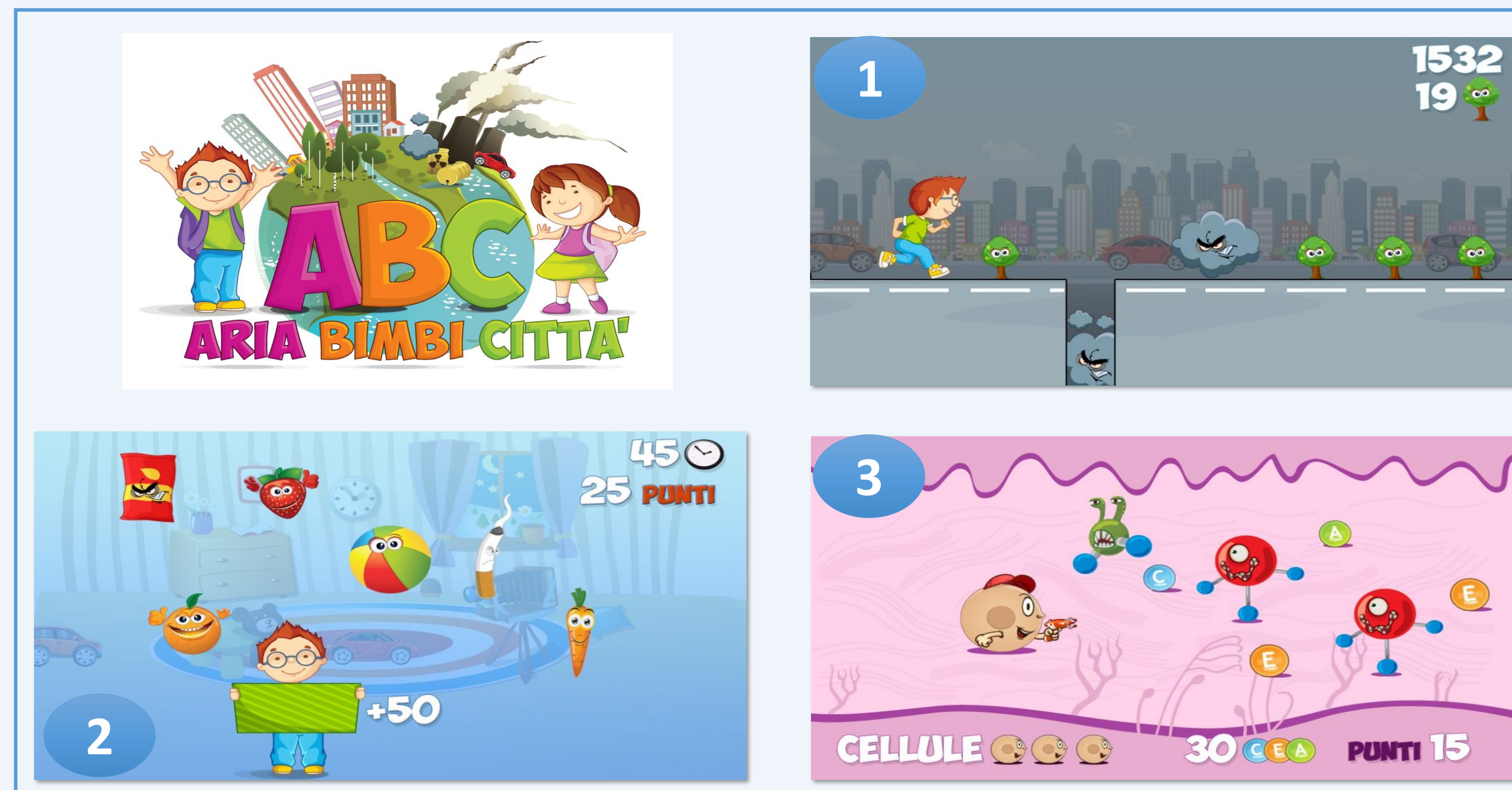
Figura 1. Ferme immagini dei 3 videogiochi educativi

Le schede didattiche prodotte per gli insegnanti ed i genitori hanno affrontato i seguenti temi: i) inquinanti atmosferici, ii) effetti degli inquinanti sulla salute, iii) effetti degli inquinanti a livello cellulare, iv) politiche ambientali e v) stili di vita sani. Il cartone animato, della durata di 2,49 minuti, narra delle avventure di Vito e Mina che si devono difendere dall'inquinamento atmosferico. Nei tre videogiochi educativi (Figura 1) sono affrontati i seguenti temi: (1) inquinamento atmosferico urbano, (2) stili di vita sani ed (3) effetti cellulari. I risultati dello studio pilota mostrano un aumento di conoscenze superiore quando vengono utilizzati gli audiovisivi rispetto al gruppo di controllo. Nella figura 2 vengono confrontati i punteggi dei questionari prima e dopo le attività didattiche e pur essendo le differenze statisticamente significative anche nel controllo, l'apprendimento risulta superiore in presenza dell'utilizzo degli audiovisivi. Applicando il test esatto di Fisher, per 8 domande del questionario è presente un aumento significativo delle risposte esatte dopo le attività didattiche con gli audiovisivi mentre nel controllo questo risultato è presente per solo una domanda (Tabella 1). In aggiunta, i bambini coinvolti nello studio hanno espresso un alto livello di gradimento delle attività didattiche effettuate in classe.